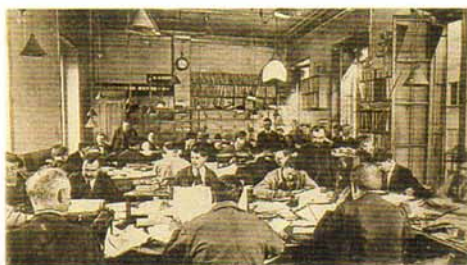
Agence Havas Information dans les années 30

Ce service fonctionnera jusqu'au 31 décembre 1947. En effet, le 30 octobre 1947, la Direction de l'Administration AFP informait simultanément tous ses clients et tout le Personnel d'être dans l'obligation de cesser l'exploitation du Service Photo à la date du 31 décembre 1947 : « Vous ne ferez plus partie de notre personnel à cette date et vous percevrez vos indemnités de licenciement ». Les 2/3 du personnel partira et percevra ses indemnités. Le quart restant refusera cette situation estimant devoir être réintégré à l'A.F.P. et, à ses risques et périls, disposant des locaux et de tous les outils de travail (plaques photos, produits de laboratoire, ronéo, machine à affranchir) continuera d'assurer une couverture parisienne aux abonnés photo.