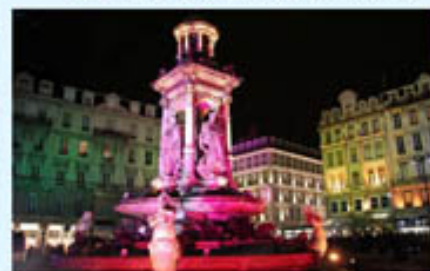
Lyon en décembre pour éclairer l'hiver.