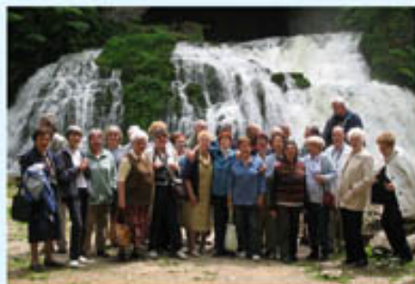
La Franche Comté cadencée... et arrosée en juin

L'ANNÉE OLYMPIQUE 2008 A ÉTÉ AUSSI POUR NOUS UNE ANNÉE SPORTIVE !!