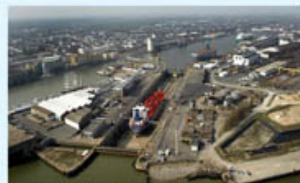
La Loire Atlantique iodée en avril