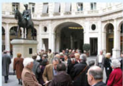
Des après-midi théâtrales