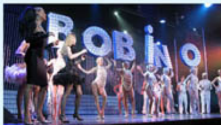
Bobino en janvier