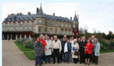
Les châteaux des Concubines à la tombée des feuilles