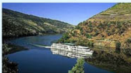
Le Douro et Lisbonne en abordant l'automne