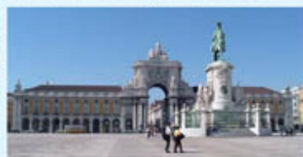
ET IL Y EN AURA ENCORE.