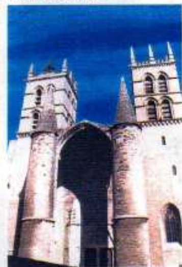
MONTPELLIER La cathédrale Saint-Pierre

Mais les bonnes choses ont une fin. Après un bon déjeuner dans une brasserie très agréable dans le quartier Antigone, nous avons regagné la gare tranquillement à pied. Le retour s'est bien passé et nous nous sommes tous quittés tout heureux de notre séjour passé ensemble.