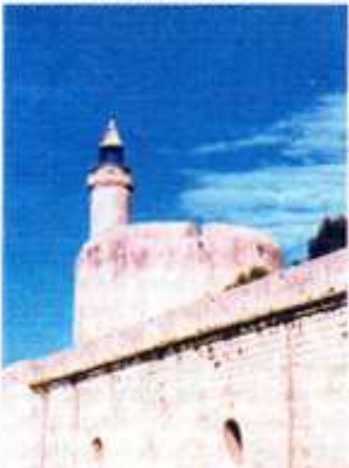
Aigues Mortes-La tour Constance

Lundi matin départ pour Aigues-Mortes. Sur la route, nous passons à La Grande Motte, le long des étangs où nous pouvons apercevoir des flamants roses. Nous longeons aussi les salines du Midi. Arrivée à Aigues-Mortes. La cité est restée intacte depuis le XIII e siècle. La tour de Constance, le logis du Gouverneur et les remparts constituent un ensemble exceptionnel. Promenade dans la cité.