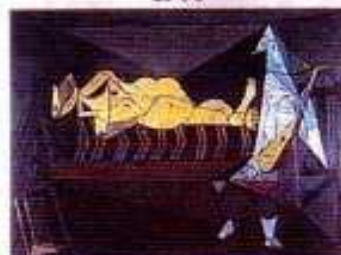
Pablo Picasso L'Aubade 1942