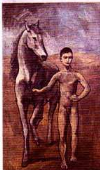
Pablo Picasso Meneur de cheval nu 1906

L'exposition réunit une centaine de peintures, une vingtaine de sculptures, une cinquantaine de dessins des deux artistes.