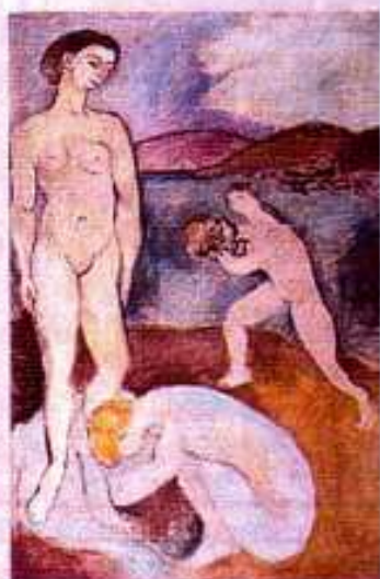
Henri Matisse Le Luxe 1907