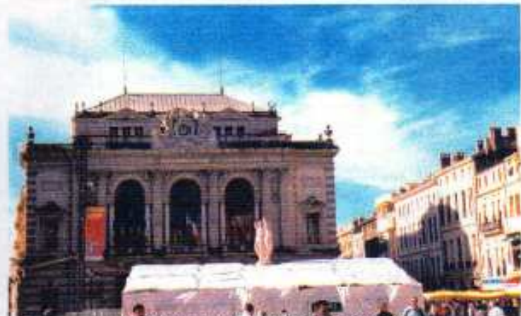
MONTPELLIER : La Place de la Comédie.

Vendredi, dernier jour. Nous sommes partis vers Montpellier. Promenade dans le centre historique. On passe avec bonheur des petites rues anciennes aux allées de la moderne Antigone. La place de la Comédie est animée comme d'habitude, Montpellier est une ville qui donne envie d'y rester plus longtemps. De plus, le ciel était d'un bleu azur et le soleil était au rendez-vous. Il aurait fait bon flâner attablé à une terrasse.