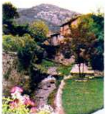
St-Guilhem-Le-Désert - Le Verdur

L'après-midi, départ pour St-Guilhem-le-Désert.