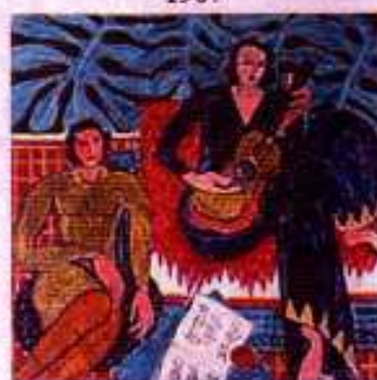
Henri Matisse La Musique 1939

Propos de Pablo Picasso « Il faudrait pouvoir mettre côte à côte tout ce que Matisse et moi avons fait en ce temps-là. Jamais personne n'a si bien regardé la peinture de Matisse que moi. Et lui, la mienne... »