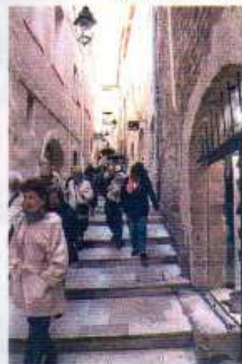
MONTPELLIER La rue du Bras de Fer